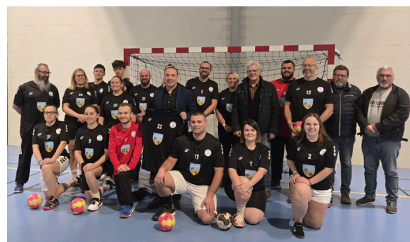
Remise des maillots au hand loisir, le 28/11, par notre sponsor "Sylvain Immobilier"